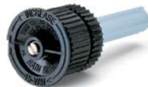
Bocais VAN pré-instalados