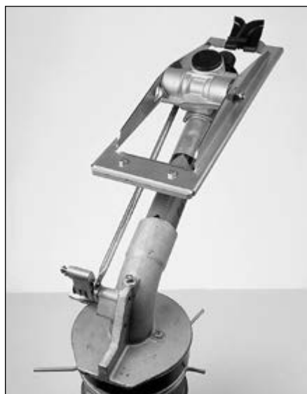
Braço de aço inoxidável com colher de Delrin®