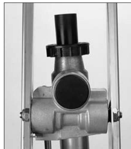
Armação do pivô do braço